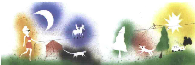
Illustrazione di Alessandro Sanna per Nidi di note , Gallucci, 2012

Chiara Carminati - ill. di Allegra Agliardi - musica di Giovanna Pezzetta, MeLa Canti? , Modena, Franco Cosimo Panini, 2011, pp. 32 + CD, euro 20,00, Collana "ZeroTre"