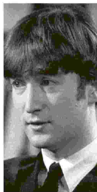
Lennon ai tempi dei Beatles