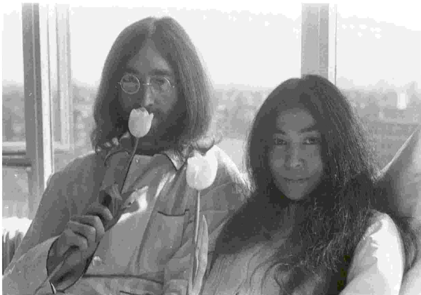
Una bella immagine di John Lennon e della moglie Yoko Ono