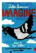
John Lennon Imagine GALLUCCI PP. 34 EURO 15

Una preghiera inesaudita oggi più che mai. C'è bisogno allora di leggerla e cantarla, seguendo con le dita i bordi dei disegni di un libro bello e piccino, che lancia un messaggio alle nuove generazioni – ma non solo a loro – e invita i bambini di oggi a non smettere di immaginare un futuro di pace, senza confini né violenza, e quelli di ieri a recuperare l'innocenza e la gioia dell'infanzia, quella del piccione sognatore portatore di pace. ◀