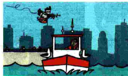
Raccontare per immagini. Alcuni dei disegni di Jean Jullien nel libro, che è una lunga "illustrazione" della canzone diventata un vero inno del pacifismo mondiale