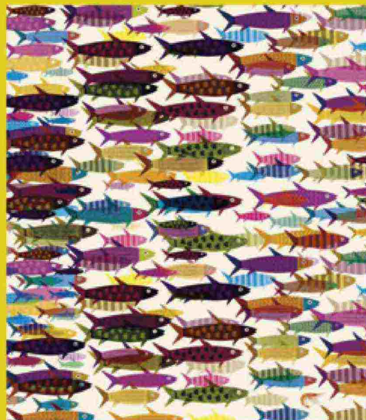
Tu lo vedi là in mezzo un bel gamberetto?

Disegna le notizie del mondo e della tua città che ti hanno colpito. E inviale a bambini@ilfattoquotidiano.com . Le metteremo sul sito