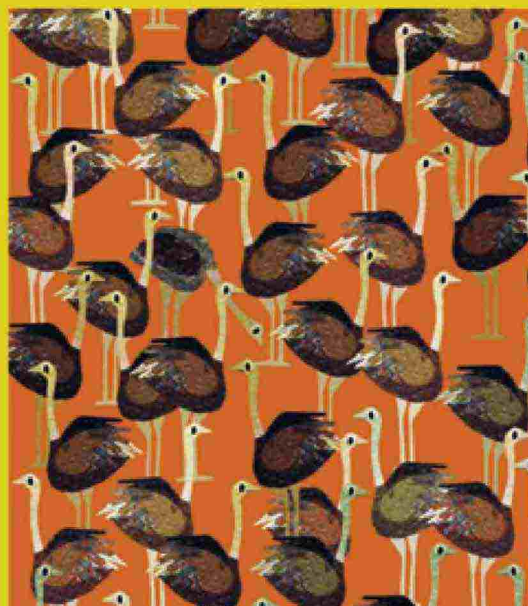
Chi ha piegato la testa e si mangia l'erbetta?