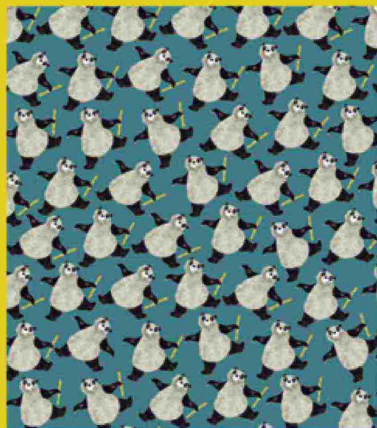
Quale dei tanti panda ha perduto il bambù?